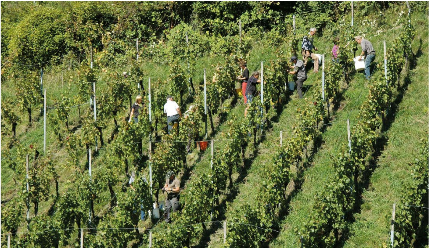
Weinlese in Röhthis