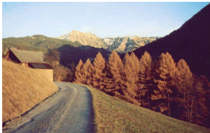
Frödischtal mit Blick zum Freschen

Den Wert des Walds verkörperte bis gegen Ende des 19. Jahrhunderts weniger der Holzvorrat als vielmehr die Eignung zur Waldweide. Daher lesen wir so häufig von „Wunn und Weid, Trieb und Tratt“. Mit „Wunn“ waren die Eicheln, die Bucheckern, das Wildobst, die Wurzeln, die Engerlinge und Würmer gemeint, kurzum alles, was der Schweinemast dienlich war. Unter „Trieb“ verstand man