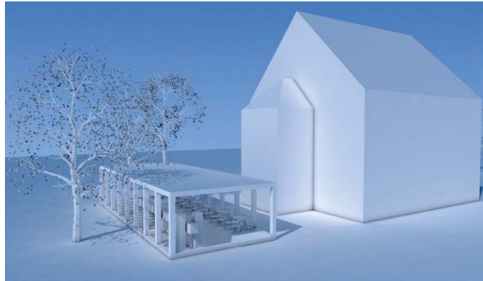
Entwurfskonzept und Lage der Umhausung für die historische Baupresse aus dem ehemaligen Restaurant Torggel beim Röthner Schlössle.

ner Schlössle, damit die historische Presse witterungsgeschützt und öffentlich zugänglich aufgestellt werden kann. Auf der Grundlage des Entwurfs von Architekt Carlo Baum-schlager soll eine Detailplanung ausgearbeitet werden.