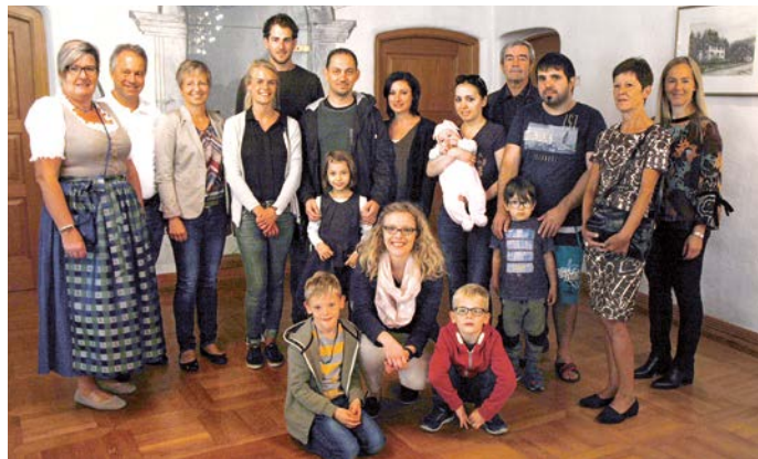
Willkommen in Röthis!

Nach dem gegenseitigen Vorstellen der TeilnehmerInnen und der GemeindevertreterInnen wurde in lockerer Atmosphäre geredet und Röthner Wein vom Weingut Nachbar verkostet. Anschließend wurden die neu Zugezogenen zum Essen und Trinken auf den Dorfmarkt eingeladen.